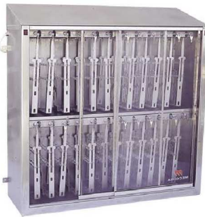
REF. DC 750