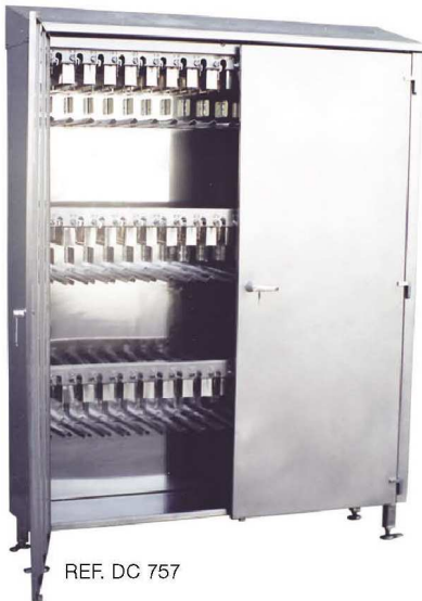
REF. DC 757