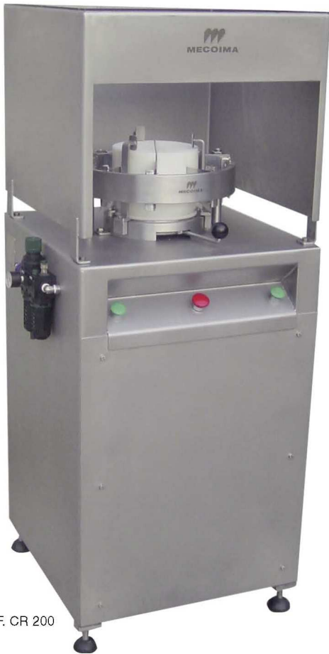
REF. CR 200